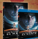
LOS ÚLTIMOS DÍAS EN MARTE