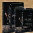
OCULUS. EL ESPEJO DEL MAL