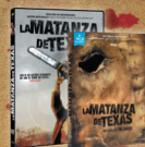
LA MATANZA DE TEXAS