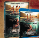
ZOMBEAVERS (CASTORES ZOMBIES)